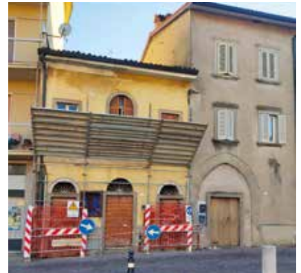
Come si presentava Casa Spini

Non solo i lavori al municipio e allo stabile di via Palestro: in questo mese di dicembre, un altro cantiere tiene banco nel centro storico. Un nuovo capitolo all'interno di un vero e proprio piano di riqualificazione del patrimonio architettonico storico che ruota attorno a Piazza IV Novembre e agli ambiti circostanti. L'obiettivo è dare nuovo splendore agli edifici del nucleo antico del paese e valorizzarli con nuove funzionalità. Casa Spini, che da anni versa in stato di semiabbandono, è oggi oggetto di interventi di riqualificazione strutturale. Un altro bando regionale di rigenerazione urbana ci ha dato accesso ad un contributo da 500mila euro che sarà parzialmente utilizzato per il restyling del vecchio immobile di fronte al municipio. Il termine dei lavori è previsto per l'autunno del 2024. L'edificio diventerà la nuova sede della Polizia Locale .