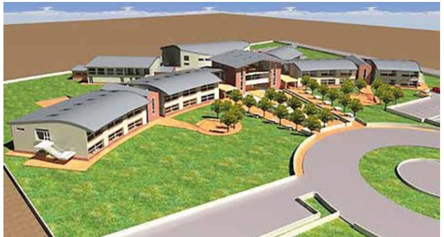
Il rendering del progetto del campus scolastico