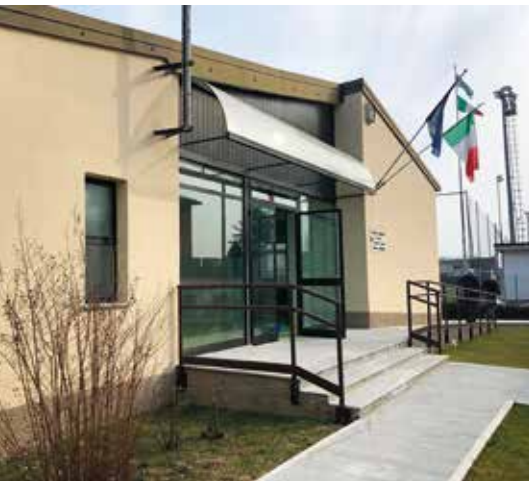
L'inaugurazione del Centro, ad inizio anno

Bisogno di essere ascoltati, ma anche ricerca di uno spazio dove esprimere le proprie doti artistico e creative