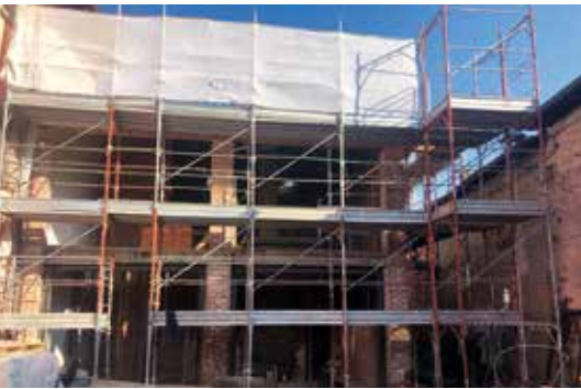
Lo stato dell'arte dei lavori ad inizio dicembre 2023

Opere possibili grazie all'assegnazione di un tesoretto da circa 1 milione di euro da parte di Regione Lombardia al nostro Comune. Il progetto che abbiamo sottoposto all'ente regionale è infatti risultato tra i più rilevanti nel Bando di rigenerazione dei borghi antichi risolto a fine 2021. Lo stabile si trasformerà in un presidio per la promozione e la valorizzazione turistica del nostro territorio!