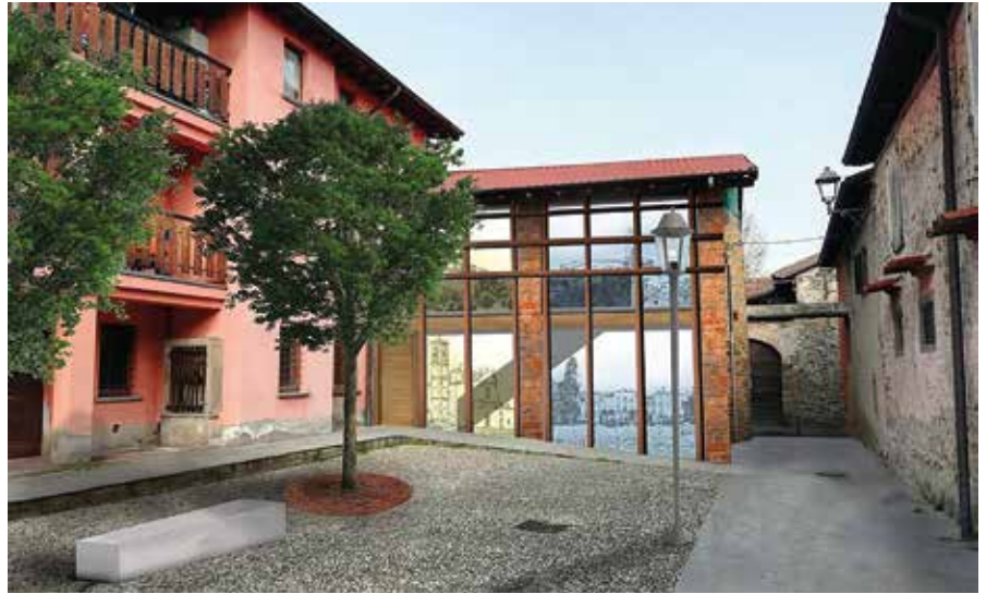
Come apparirà il nuovo stabile di via Palestro

Nella tarda primavera del 2024 dovrebbero concludersi gli interventi di recupero e riqualificazione dell'ex fiendale di via Palestro , situato di fronte al parcheggio del municipio. Da maggio sono in corso i lavori che, oltre a restituire uno stabile moderno dalle ampie vetrate, rinnoveranno la piazzetta antistante con nuova pavimentazione, verde e arredi urbani.