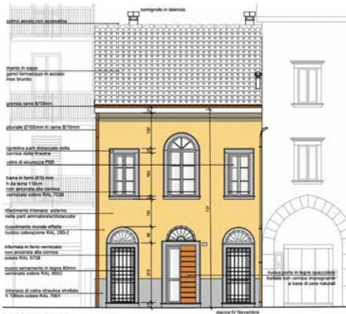
Il progetto di riqualificazione della facciata

Non solo i lavori al municipio e allo stabile di via Palestro: in questo mese di dicembre, un altro cantiere tiene banco nel centro storico. Un nuovo capitolo all'interno di un vero e proprio piano di riqualificazione del patrimonio architettonico storico che ruota attorno a Piazza IV Novembre e agli ambiti circostanti. L'obiettivo è dare nuovo splendore agli edifici del nucleo antico del paese e valorizzarli con nuove funzionalità. Casa Spini, che da anni versa in stato di semiabbandono, è oggi oggetto di interventi di riqualificazione strutturale. Un altro bando regionale di rigenerazione urbana ci ha dato accesso ad un contributo da 500mila euro che sarà parzialmente utilizzato per il restyling del vecchio immobile di fronte al municipio. Il termine dei lavori è previsto per l'autunno del 2024. L'edificio diventerà la nuova sede della Polizia Locale .