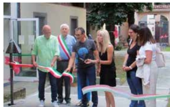
L'inaugurazione del nuovo campo da bocce

Recentemente, il 16 settembre è stato inaugurato il nuovo campo da bocce regolamentare con fondo in erba sintetica, utilizzabile da tutta la popolazione di Mapello e paesi limitrofi per giocare, socializzare e divertirsi in modo sano. Tra i proget-