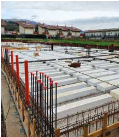
Le fondamenta delle scuole primarie in costruzione

che per oltre vent'anni ha vissuto importanti stop. L'obiettivo resta quello di consegnare ai mapellesi del futuro delle infrastrutture scolastiche moderne, comode, belle e sicure, per migliorare la loro esperienza didattica e i servizi a loro supporto. L'inizio delle lezioni in questo nuovo plesso scolastico è previsto per il mese di settembre del 2025 .